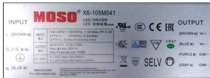
Foto 4. Driver