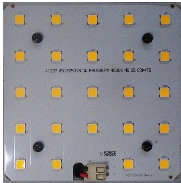
Foto 5. Módulos de LED